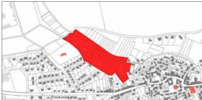
Geltungsbereich Bebauungsplanentwurf „Vor dem Weinberg - Teil II, Änderung und Erweiterung II“ der Ortsgemeinde Göllheim