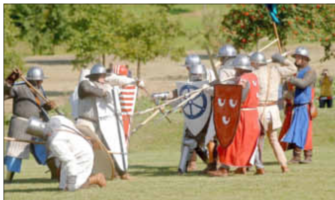
Landsknechte beim Kampf und vieles andere mehr gibt es beim Göllheimer Frühjahrsmarkt zu bestaunen.