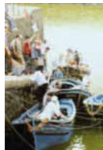
Fischer Essaouira Marokko (Öl)