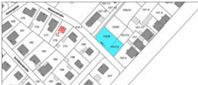
Geltungsbereich des Bebauungsplans „Alter Ortskern II, Änderung I, 1. Teiländerung“ der Ortsgemeinde Bubenheim