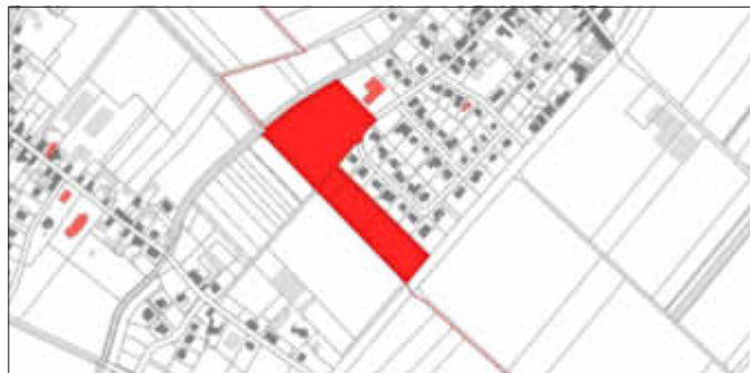
Neuer Geltungsbereich des Bebauungsplanes „Obere Wiesen“ der Ortsgemeinde Bubenheim