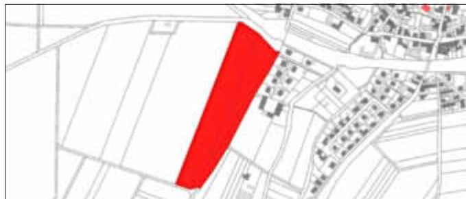
Geltungsbereich des Bebauungsplans „Am Immesheimer Weg“ der Ortsgemeinde Zellertal