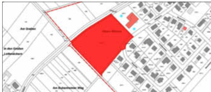
Bisheriger Geltungsbereich des Bebauungsplanes „Obere Wiesen“ der Ortsgemeinde Bubenheim