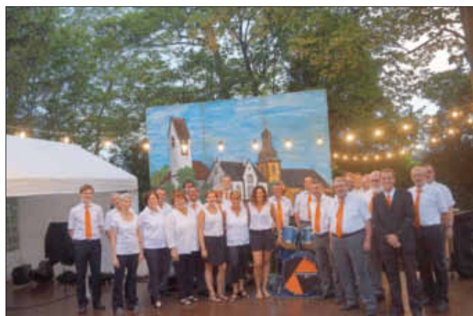
Die Kolpingkapelle Zell unterhält Sie an beiden Tagen

Aufgrund der Sperrung der B47 zwischen Albisheim und Harxheim ist eine Anreise aus südlicher Richtung nur über Niefernheim möglich. Die anderen Zufahrtswege über Einselfthum und Mölsheim sind wie gewohnt offen. Die Kolpingsfamilie Zell lädt Sie recht herzlich ein und freut sich auf ihren Besuch.