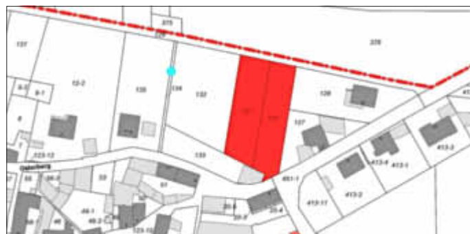
Geltungsbereich des Bebauungsplanes „Osterberg, 1. Teiländerung“ der Ortsgemeinde Zellertal