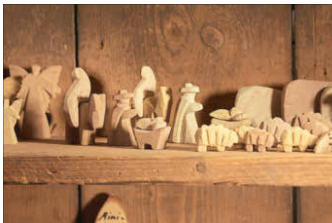
Auf dem Weg