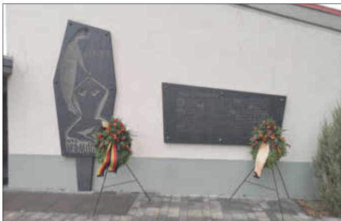
Die Kränze des VdK und der Ortsgemeinde Bubenheim am Ehrenmal auf dem Friedhof in Bubenheim

Bei einer durchgeführten Sammlung konnten 63 EUR für die Arbeit des Volksbundes Deutscher Kriegsgräberfürsorge gesammelt werden.