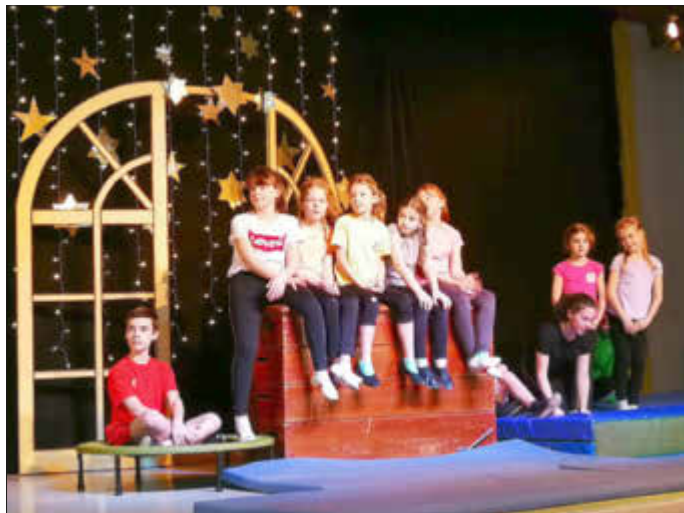
Die jugendlichen Turnerinnen und Turner nach ihrer Vorführung