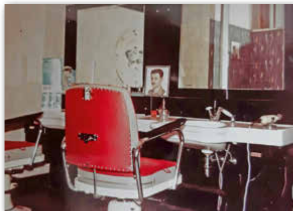
1956 | Herrenplatz in der Ebertsheimer Straße

1956 erfolgte der Umzug in die Ebertsheimer Straße (jetzt Videothek).