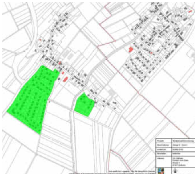
Anlage - Zone 2