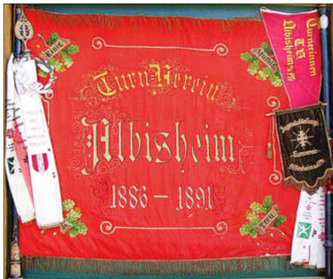
Vereinsfahne TSG 1886 Albisheim