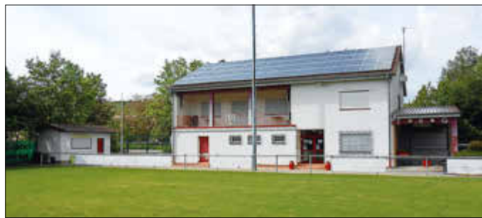
neues Sportheim erb. 1999

Die TSG unterhält zurzeit folgende Abteilungen: Fußball (Jugend, Aktive, AH), Kinderturnen, Gymnastik Damen, Gymnastik Senioren, Zumba, Rope Skipping, Body-Fit, Sportabzeichen. Alle Abteilungen sehen sich dem Pandemieende entgegen, wo sie dann wieder problemlos ihren Sport ausüben können. Auch für das Kinderturnen am Mittwoch ist ein Neuanfang in Aussicht.