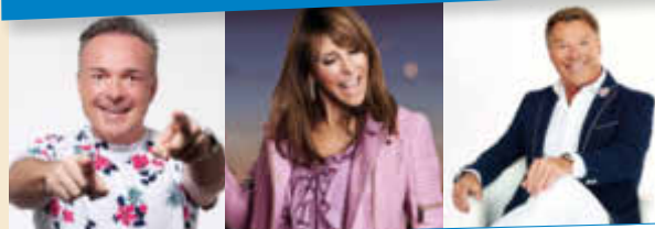
Tim Toupet, Ireen Sheer und Patrick Lindner