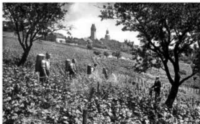
Die Arbeiten im Weinberg waren früher bedeutend aufwendiger. Hier werden die Weinberge von gleich vier Arbeitern gleichzeitig mit einer "Druckbuckelspritze" bearbeitet.