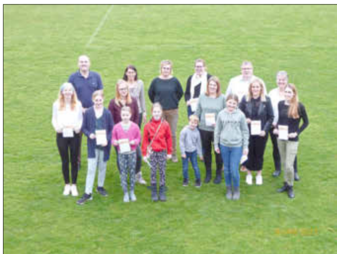
Glückliche Sportabzeichen-Gewinner bei der TSG-Albisheim