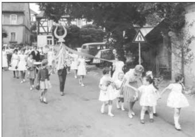
Früher war es ein beliebter Brauch, bei Jubiläumsfesten des Gesangvereins einen Umzug durch Weitersweiler zu organisieren.

In einer Talkrunde „Das war 2022“ blicken die örtlichen Gruppierungen auf das außergewöhnliche Jahr 2022 zurück. Bei Kaffee und Kuchen präsentiert der Historische Arbeitskreis eine Ausstellung mit zahlreichen Fotos aus vergangenen Jahrzehnten, auf denen die Besucher sich selbst, ihre Eltern, Großeltern oder Weggefährten aus früheren Zeiten entdecken können. Die Bilder sollen zum Austausch anregen und an das frühere Leben in Weitersweiler erinnern.