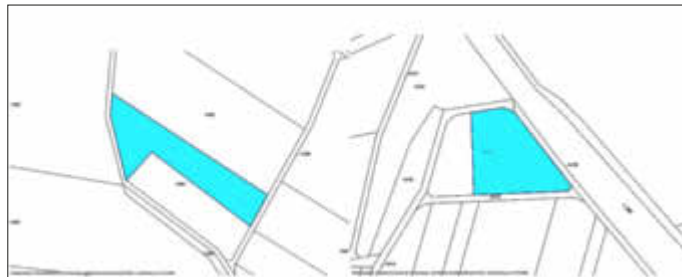
Geltungsbereich externer Ausgleichsflächen