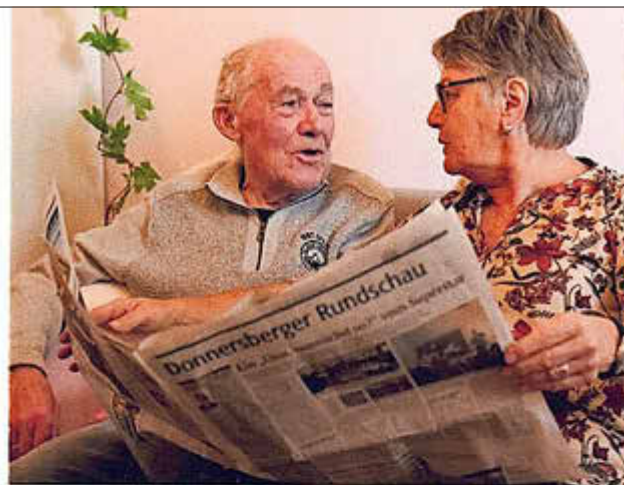
Ökumenische Sozialstation Donnersberg-Ost

Um Voranmeldung zum Heringessen wird gebeten, weitere Infos unter 06352-7495486 oder 06352 705970.