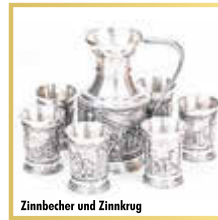
Zinnbecher und Zinnkrug