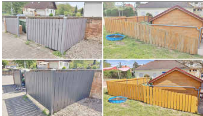
Vorher-nachher: Beispiele der Arbeit

Gemeinsam wurden unter anderem Zäune, das Treppengeländer und die Sitzbank an der Bushaltestelle geschliffen und frisch gestrichen. Die neu angelegte Kräuterschnecke im Außengelände sorgt sicherlich für strahlende Augen bei den Kindern der Kita. Das reparierte Sonnensegel über dem Sandkasten bietet nun wieder Schutz an sonnigen Tagen. Die Gemeinde stellte das Material zur Verfügung und unterstützte zusammen mit dem Team der Kita mit Getränken, Fleischkäsebrötchen und Kuchen die motivierten Helfer*innen. Der Elternausschuss der Kita bedankt sich aufrichtig für den beherzten Einsatz aller Beteiligten. Es ist großartig, dass Menschen bereit sind, sich in ihrer Freizeit für die Kita Zellertal einzusetzen. Mehr Bilder unter https://kita-zellertal.de