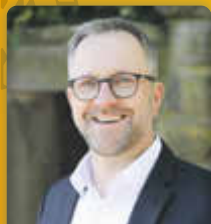
Steffen Antweiler Verwaltungsfachwirt Bürgermeister der Verbandsgm. Göllheim Ortsbürgermeister Rüssingen