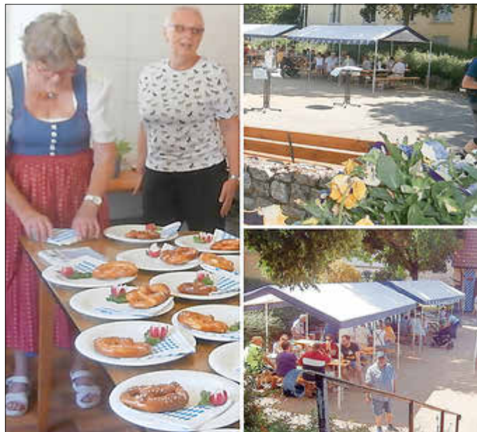
Die Vorstandschaft freut sich auf Ihr Kommen.

Am Sonntag, den 9. Juni 2024 findet ab 10.00 Uhr am Dorfplatz in Niefernheim das 2. Bayrische Frühstück statt. Hierzu lädt der Förderverein „Niefernheimer Glockenturm e.V.“ herzlich ein. Wir versprechen, dass ein Besuch bei uns die ERSTE Wahl an diesem Superwahltag ist. Mit Weißwurst, Brezeln, Fleischkäsbrötchen und Obazda möchten wir Ihren Gaumen verwöhnen. Ein frischgezapftes Weizenbier oder ein kühles Pils -natürlich gerne auch alkoholfrei- oder andere alkoholfreie Getränke lassen bei hoffentlich weiß-blauem Himmel und strahlendem Sonnenschein keine Wünsche offen. Wir versprechen, dass Sie sich bei uns in Niefernheim, dem schönsten Ortsteil der Gemeinde Zellertal, wohlfühlen werden und am Ende feststellen: heute haben wir eindeutig die BESTE WAHL getroffen.